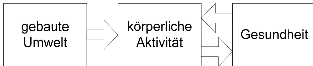
Abbildung 1: Exemplarisches Denkmodell nach Frank et al. (2006)